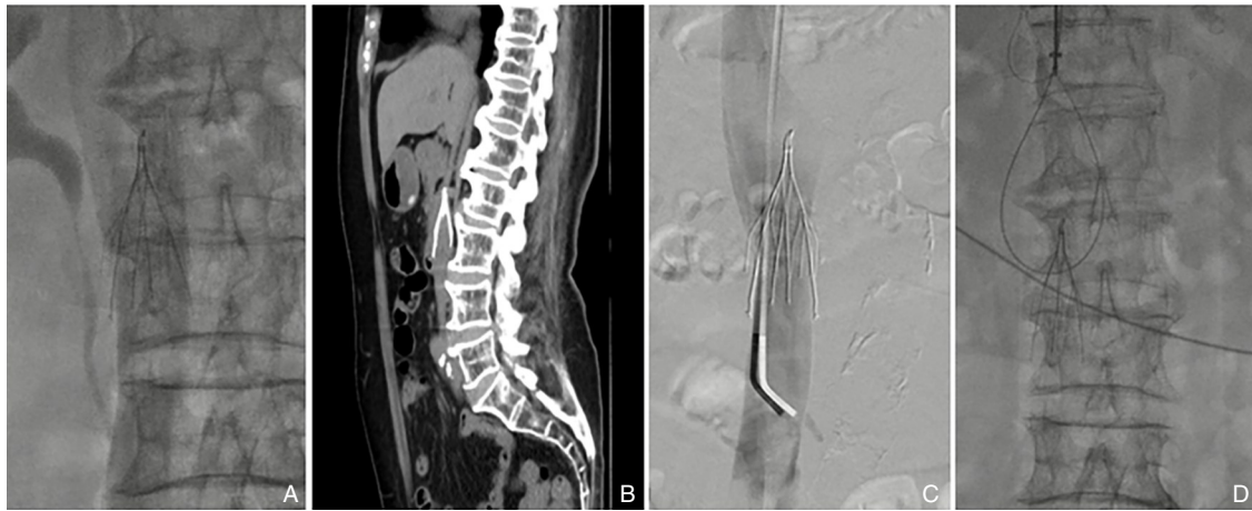
图2 Octoparms 滤器的置入与取出 A: 滤器的置入, 位置、形态良好; B: 滤器回收贴壁; C: 滤器贴壁、头端移位至左肾静脉开口; D: 常规圈套失败后 LOOP 技术取出